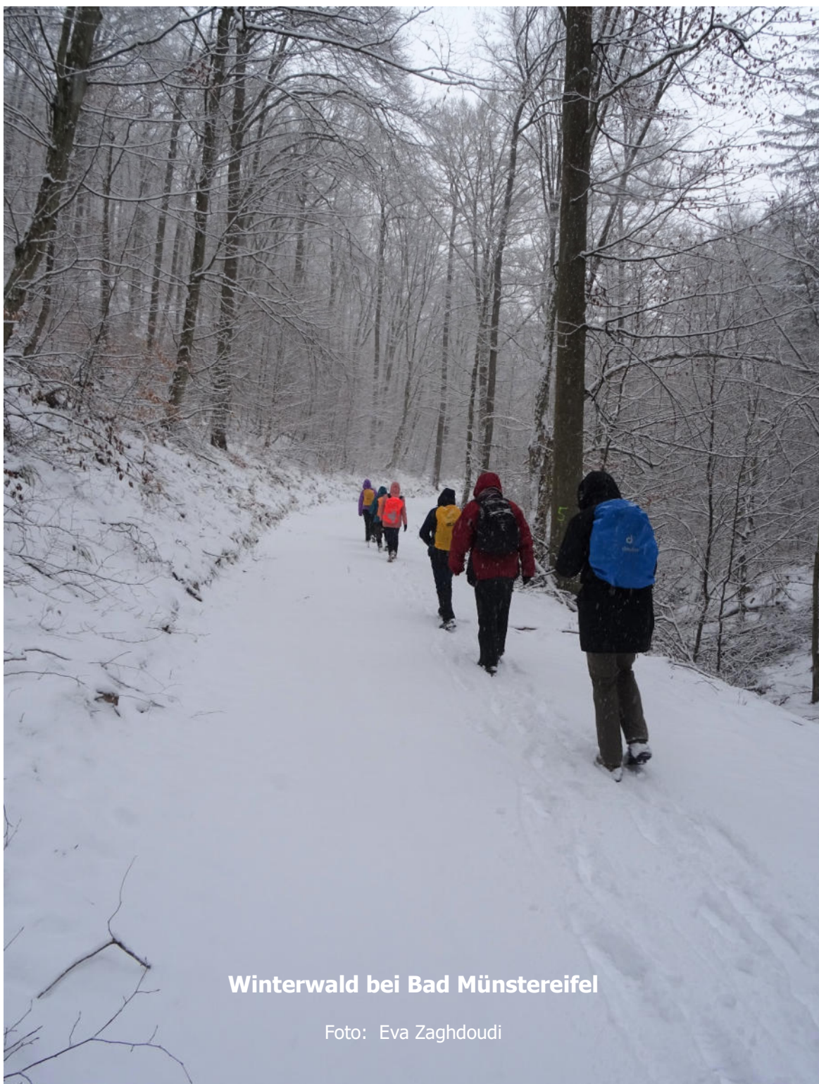
Winterwald bei Bad Münstereifel