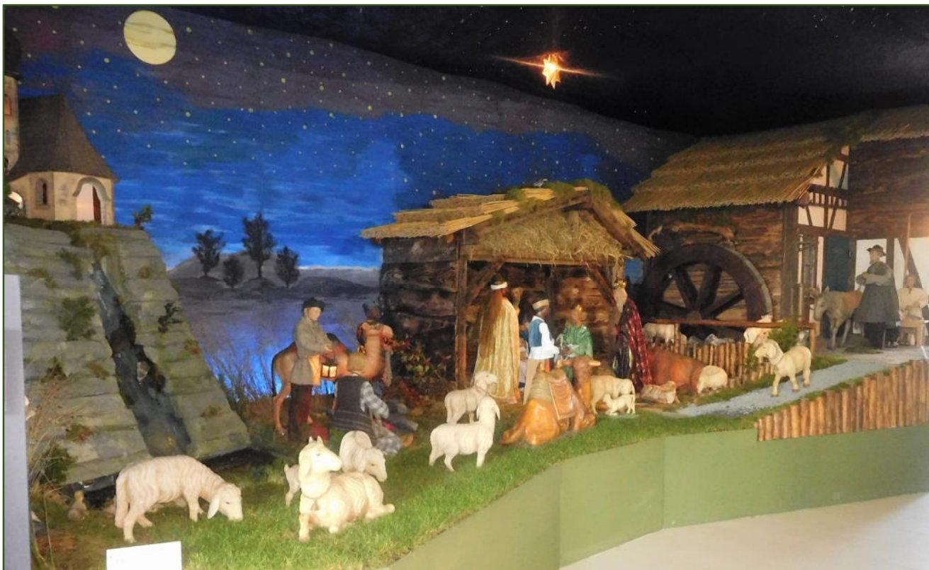
Krippenlandschaft in der St. Luzia Kirche in Eicherscheid/Simmerath

Der Zauber der Hoffnung kennt unendlich viele Lichter, die sich nicht löschen lassen.